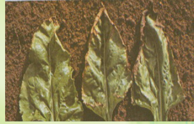
أعراض نقص عنصر البوتاسيوم