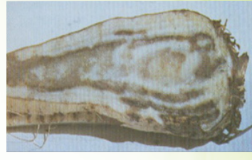
أعراض نقص عنصر البورون