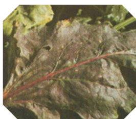
أعراض نقص عنصر الفوسفور