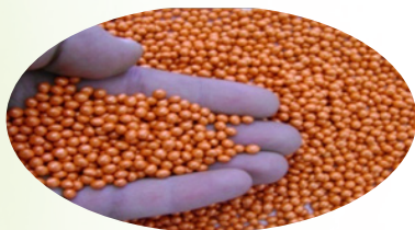
بذار وحيد الجنين

٢ ( بذار وحيد الجنين الوراثي : يحتاج الهكتار إلى ١,٤ وحدة بذرية ( الوحدة البذرية / ١٠٠ ألف بذرة )