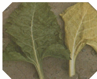
أعراض نقص عنصر الأزوت