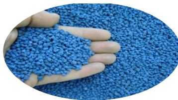
بذار متعدد الأجنة