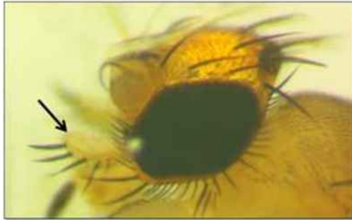
الشكل 6. الملامس الشفوية لذبابة الزومبي Apocephalus borealis .

تتميز الملامس الشفوية بحجمها الكبير) الشكل 5). أما قرن الاستشعار أريستي كمثري الشكل، تتوضع عليه عدد من الأشواك) الشكل 6).