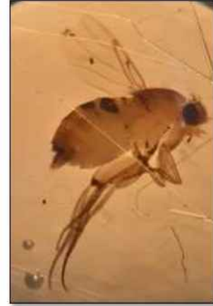
الشكل 3. الحشرة الكاملة لذبابة الزومبي Apocephalus borealis .

تتميز الملامس الشفوية بحجمها الكبير) الشكل 5). أما قرن الاستشعار أريستي كمثري الشكل، تتوضع عليه عدد من الأشواك) الشكل 6).