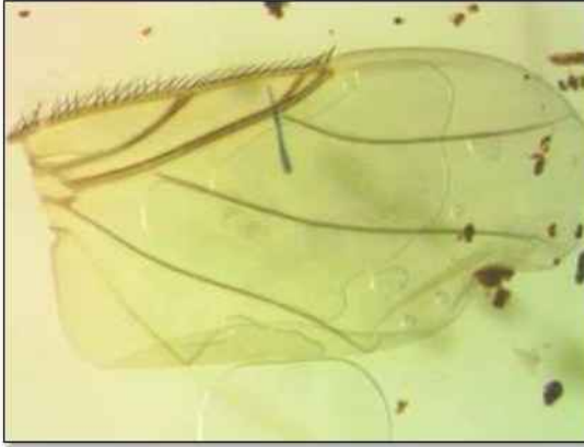
الشكل 4. تعريق الجناح في ذبابة الزومبي Apocephalus borealis .

الأجنحة شفافة تضيق عند القاعدة مع عدد قليل من العروق (الشكل 4). العرق الضلعي costa vein سميك حتى منتصفه، عليه صف من الأهداب المت ارسفة بشكل منتظم، طول الجزء الأمامي منه حوالي ضعف جزئه الثاني، أما الجزء الأخير منه ضيق بشكل واضح. العرقين الثاني والثالث سميكان، أما العرق ال اربع فهو منحني بشكل واضح.